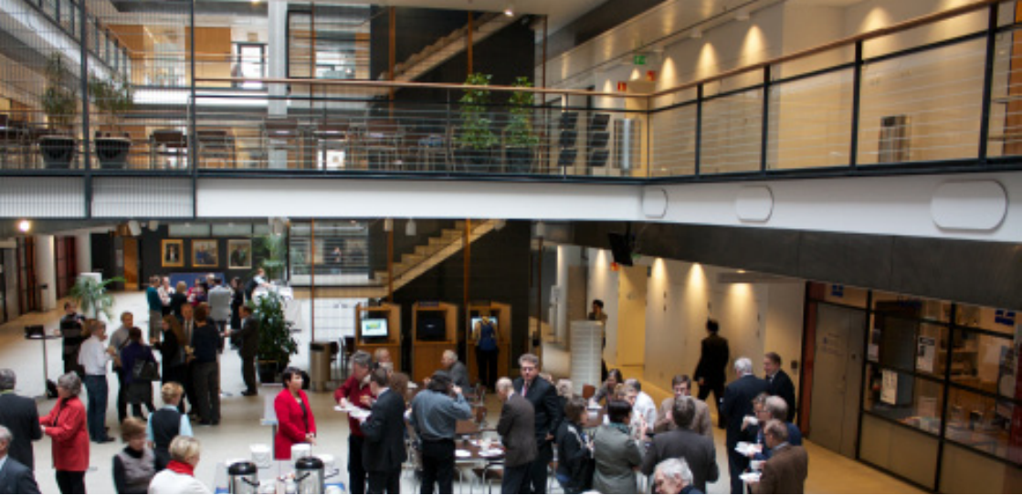
Kuva: SFY:n ja SKFY:n kevätSYMPOSIUMIN osallistujia Biomedicumissa kahvitaulla.